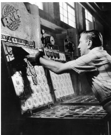
На фото: Производство каблучков для обуви Freudenberg & Co. KG

Ресурсы истощались, но мужества и оптимизма хватало. В середине 1930-х годов в Германии становилось все труднее найти кожу. Это было одним из следствий нацистской экономической политики. Как всегда, для Freudenberg это не стало поводом для отчаяния. Они увидели в этом шанс пойти в новом направлении. По мере того, как запасы кожи иссякали, они продолжили исследования и разработки, пока не нашли эквивалентную альтернативу. Каучук стал отличным материалом для уплотнителей. Они разработали уплотнительное кольцо из Perbunan (бутадиен-нитрильный каучук) - синтетического каучука. С этим новым продуктом Freudenberg вновь установил стандарты, которые привлекли международное внимание. Разработка Simmering® в 1932