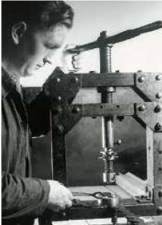
На фото: Изготовление первых уплотнителей на винтовом прессе 1929

компании работало уже 3500 человек. Чтобы удержать компанию на плаву и избежать массовых увольнений, управляющие решили переключить производство на изготовление уплотнительных втулок. Естественно, они были сделаны из кожи - того же основного материала, с которым все